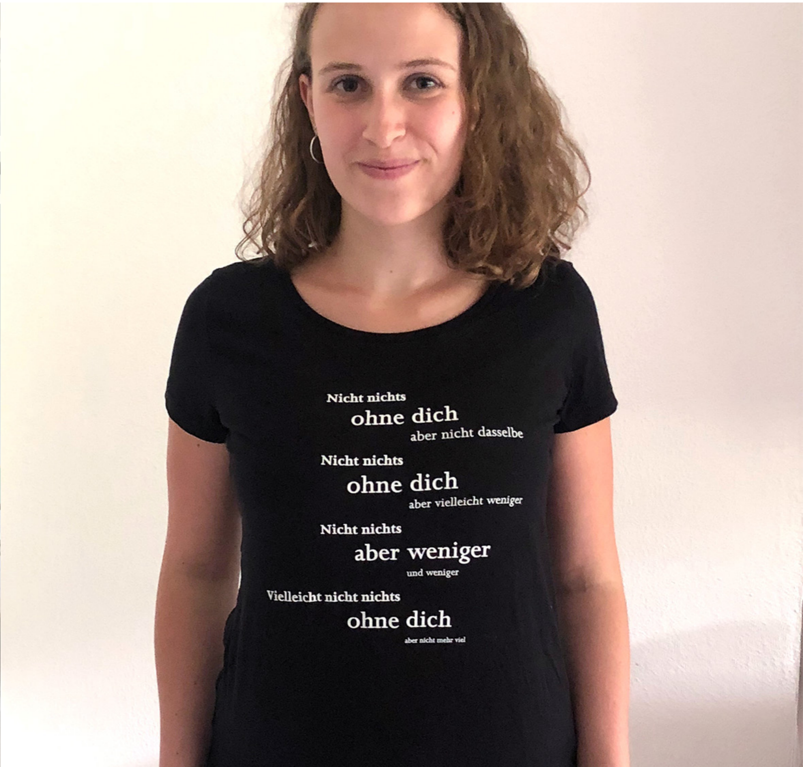
Siegerentwurf, Katharina Reichelt