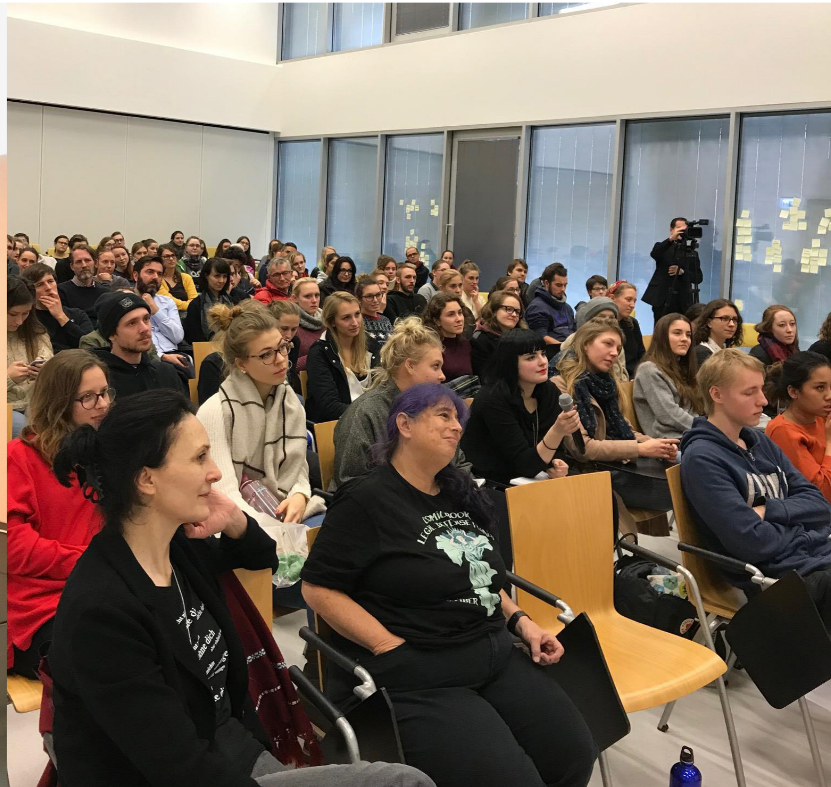
Lunchtime Lecture: Scott McCloud