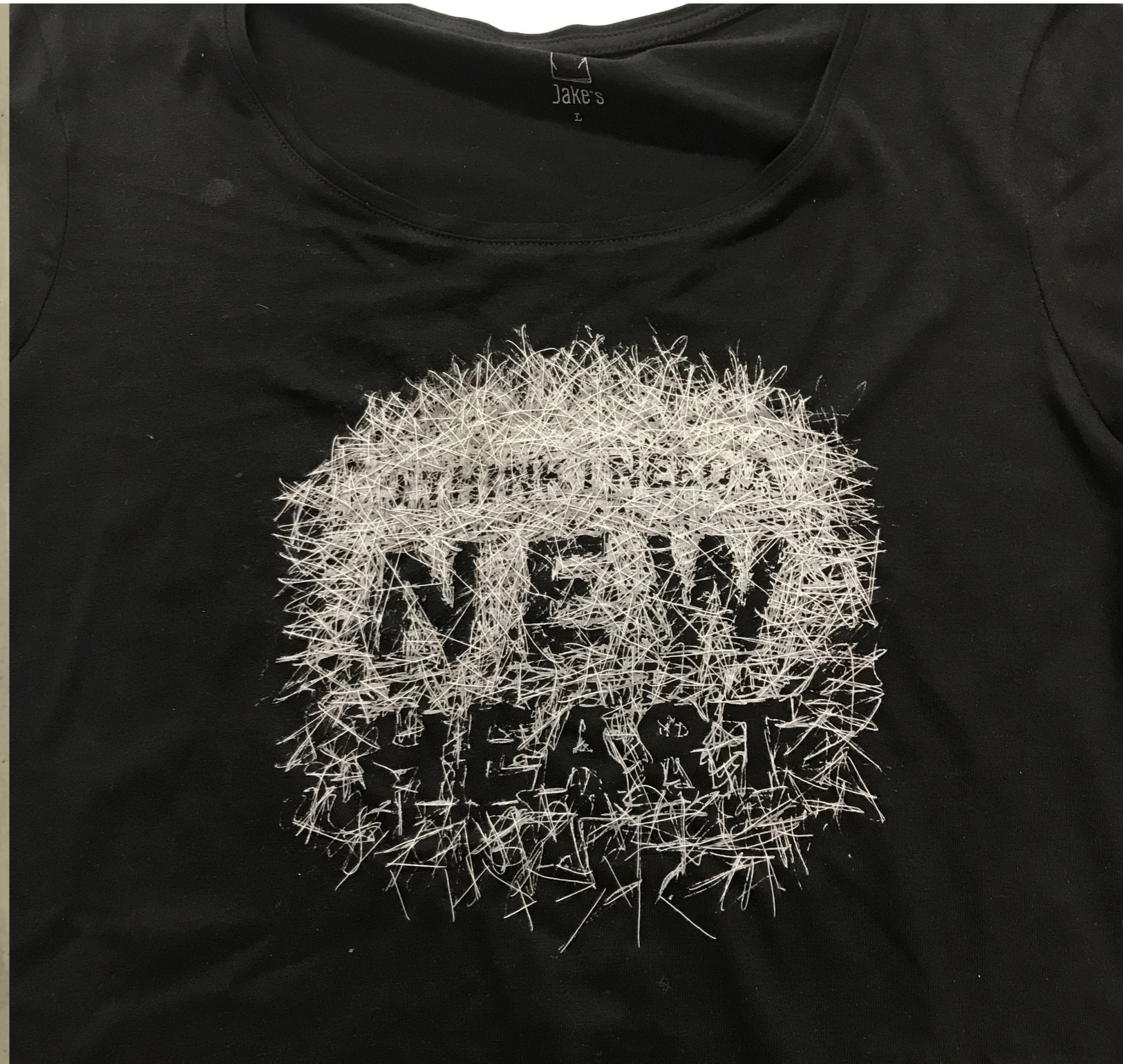
Abb. 6: Ulrike Pötschke, 2017